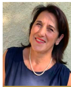
STEVANATO Guidonia (Italia)